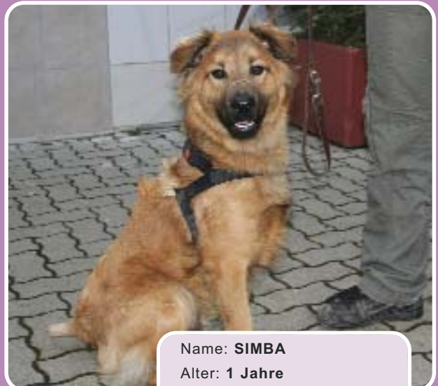
Name: SIMBA Alter: 1 Jahre Rasse: Haryerfuchsmix Geschlecht: Männlich