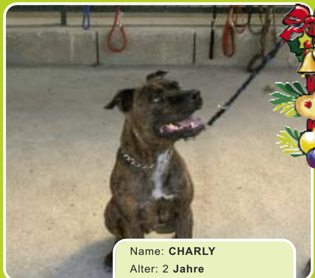
Name: CHARLY Alter: 2 Jahre Rasse: Stafford Geschlecht: Männlich