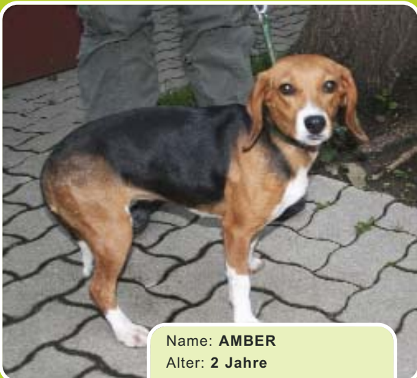
Name: AMBER Alter: 2 Jahre Rasse: Beagle Geschlecht: Weiblich