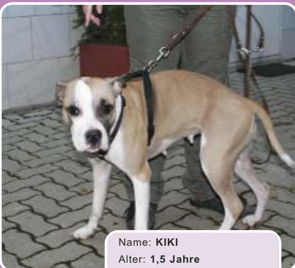
Name: KIKI Alter: 1,5 Jahre Rasse: Boxermix Geschlecht: Weiblich